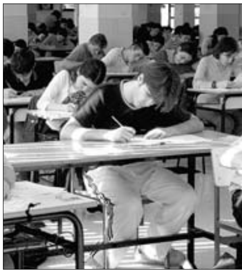
► Jóvenes asturianos en la selectividad.

El 70% de los jóvenes utiliza Internet para solicitar la revisión de exámenes